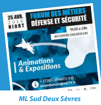
ML Sud Deux Sèvres