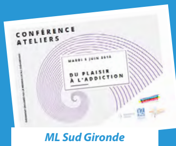
ML Sud Gironde